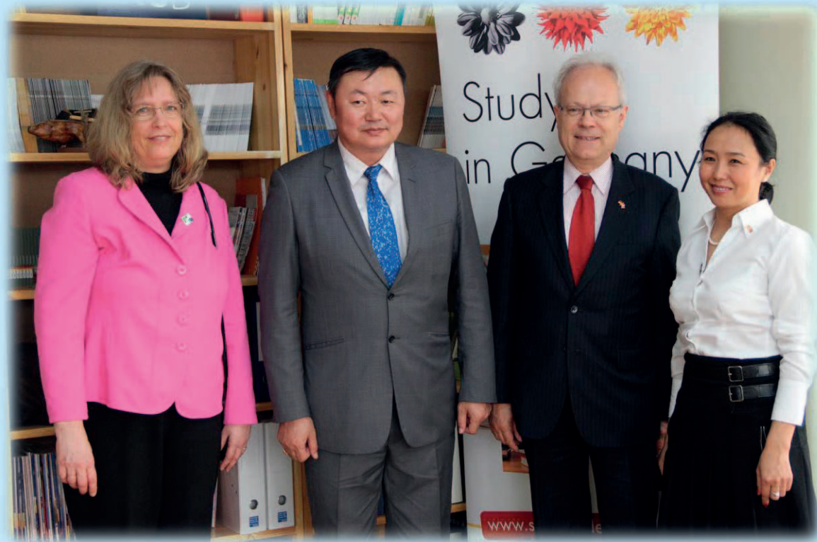
Bei der Auftaktveranstaltung im April 2016 waren auch der damalige Rektor der MUBIS und der deutsche Botschafter in der Mongolei anwesend