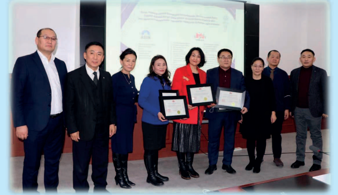
Die Aktivitäten im Rahmen der GIP haben für die Akkreditierung des Deutschstudiengangs durch AQUIN eine wichtige Rolle gespielt