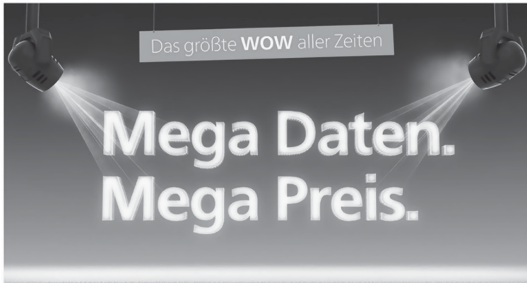
Abb. 3: O2-Werbung 2017

Mega-EVENT vs. ein mega EVENT . Für diese Entwicklung steht nicht die technische Bedeutung im Vordergrund (die die Etablierung dieses Elements im Deutschen aber sicher gestützt hat), sondern eher englische Bildungen wie Megastar , in denen schon die evaluierende Bedeutung vorliegt.